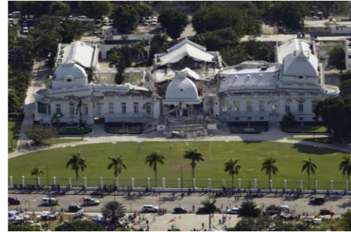
Le Palais National en ruines

de Port-au-Prince par des colons français. À l'époque elle n'était pas encore la capitale. Ce n'est qu'en 1770 qu'elle est devenue, soit l'année de la deuxième secousse dévastatrice. Il n'y pas de données statistiques concernant ces deux événements, mais nous savons que presque aucune maison n'était restée debout. C'est donc la troisième fois que la ville était touchée.