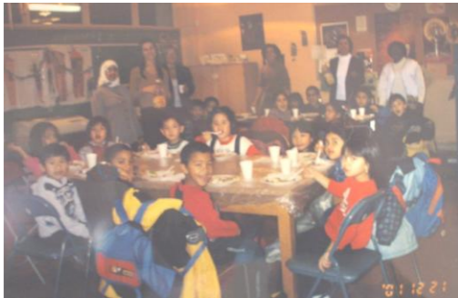
Un groupe d'enfants de l'Atelier d'Aide aux Devoirs à Kouzin Kouzin'

Enfin, beaucoup de remerciements aux bénévoles qui assistent à ces activités parce qu'ils font d'énormes efforts pour nous faire comprendre et apprendre, pour nous aider à avoir confiance en nous-mêmes et donc pour nous assurer un progrès scolaire remarquable.