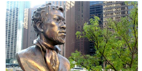
Jean Baptiste Pointe du Sable

Comme disait Bob Marley « Time will tell » = (Le temps le dira)